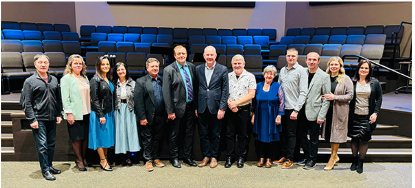
Фото с поэтом, композиторами и певцами