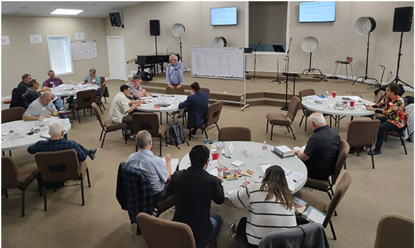
Во время тренинга