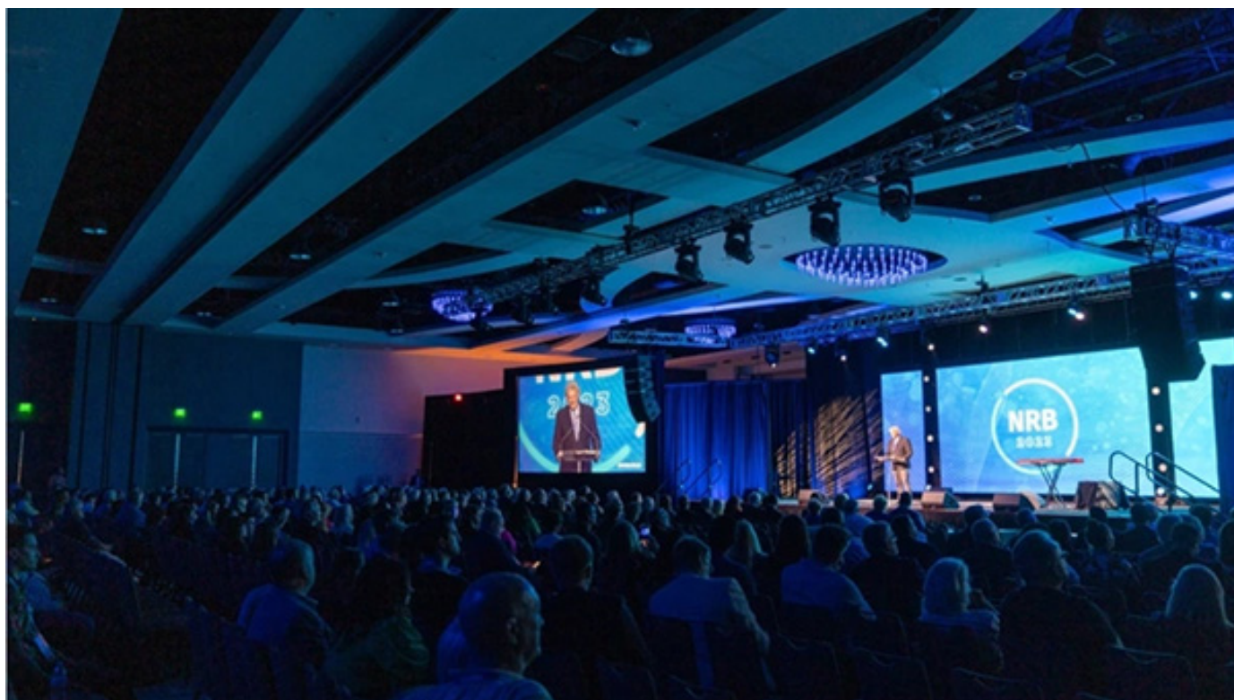
Франклин Грэм во время выступления на съезде