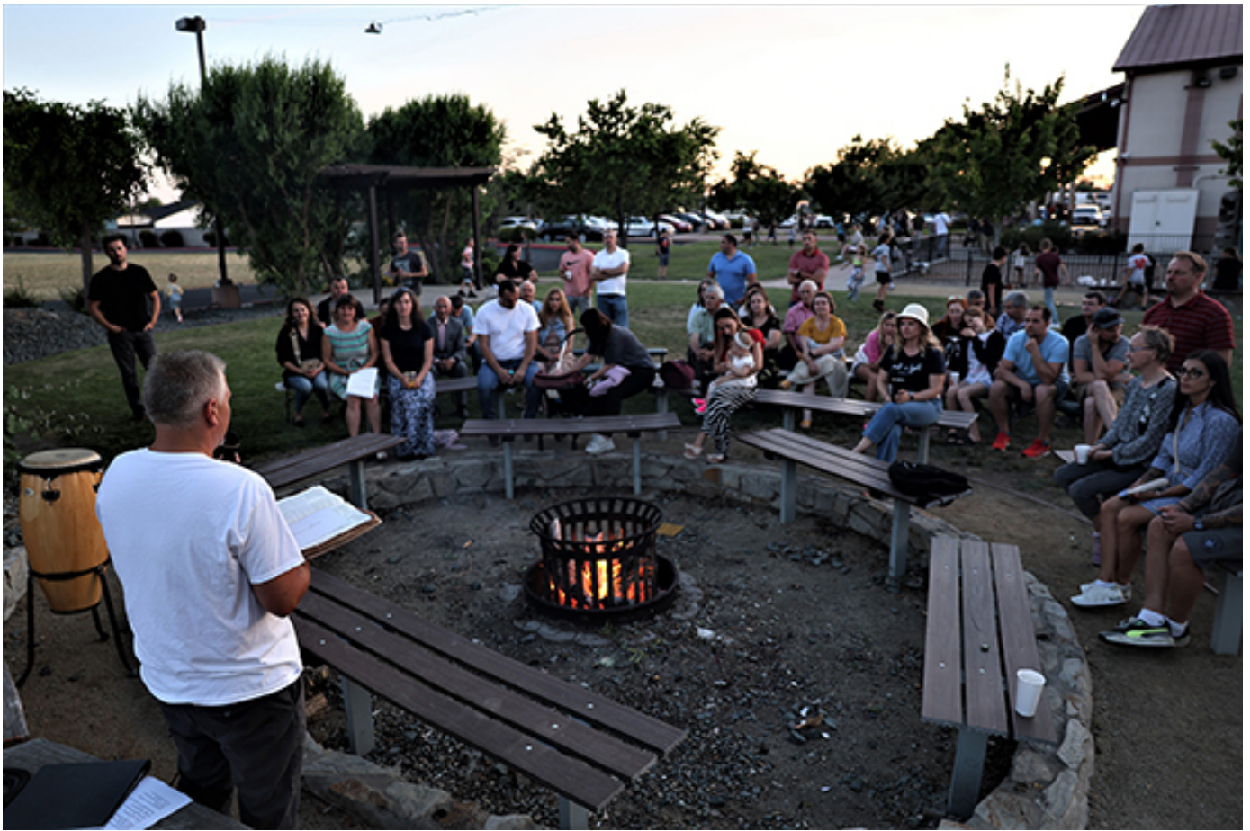
Беседы у костра