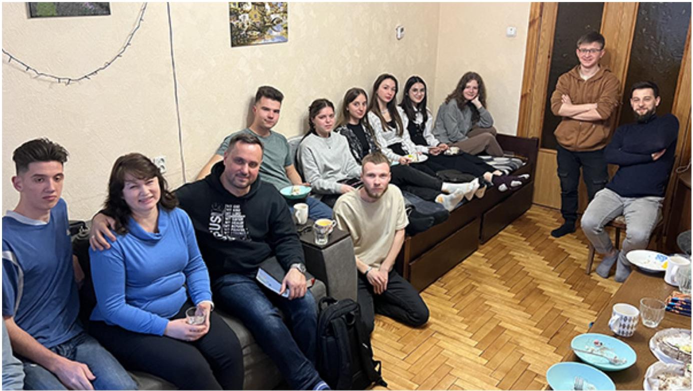
Встреча с молодежной домашней группой беженцев с востока Украины