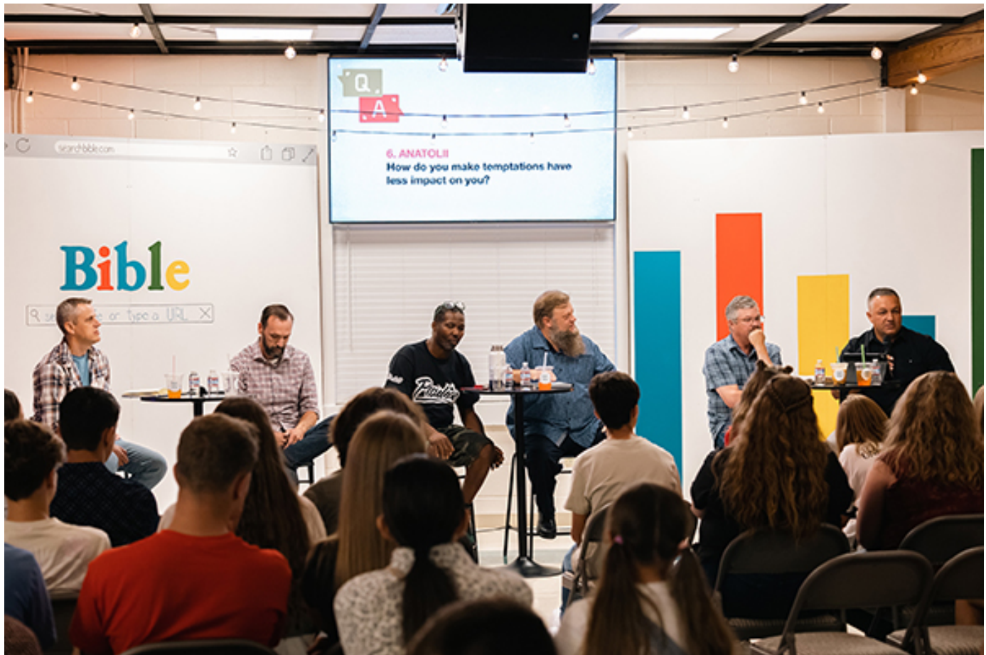
Спикеры отвечают на вопросы молодежи