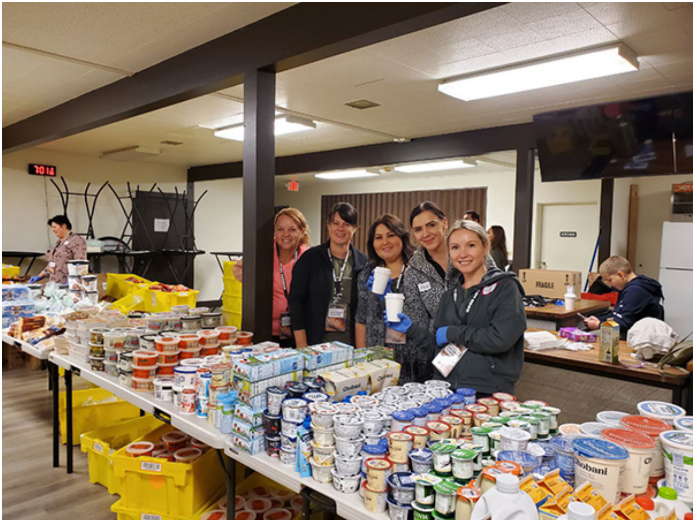
Фудбанк обслуживается волонтерами церкви