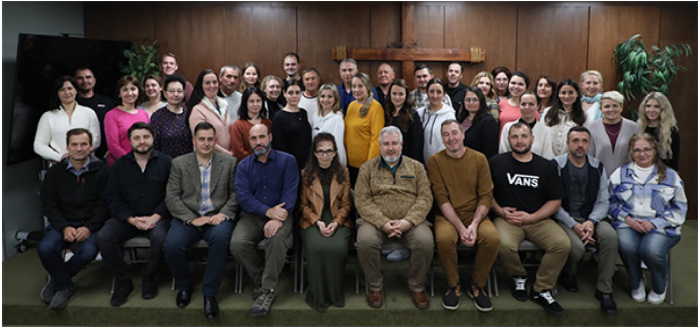
Традиционная фотография в конце модуля