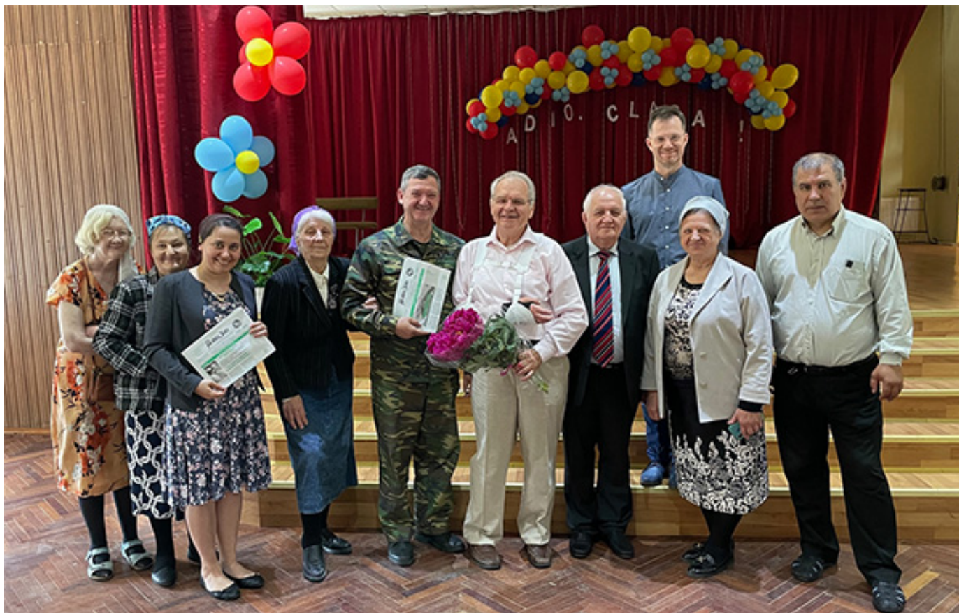
Одна из встреч в Молдове