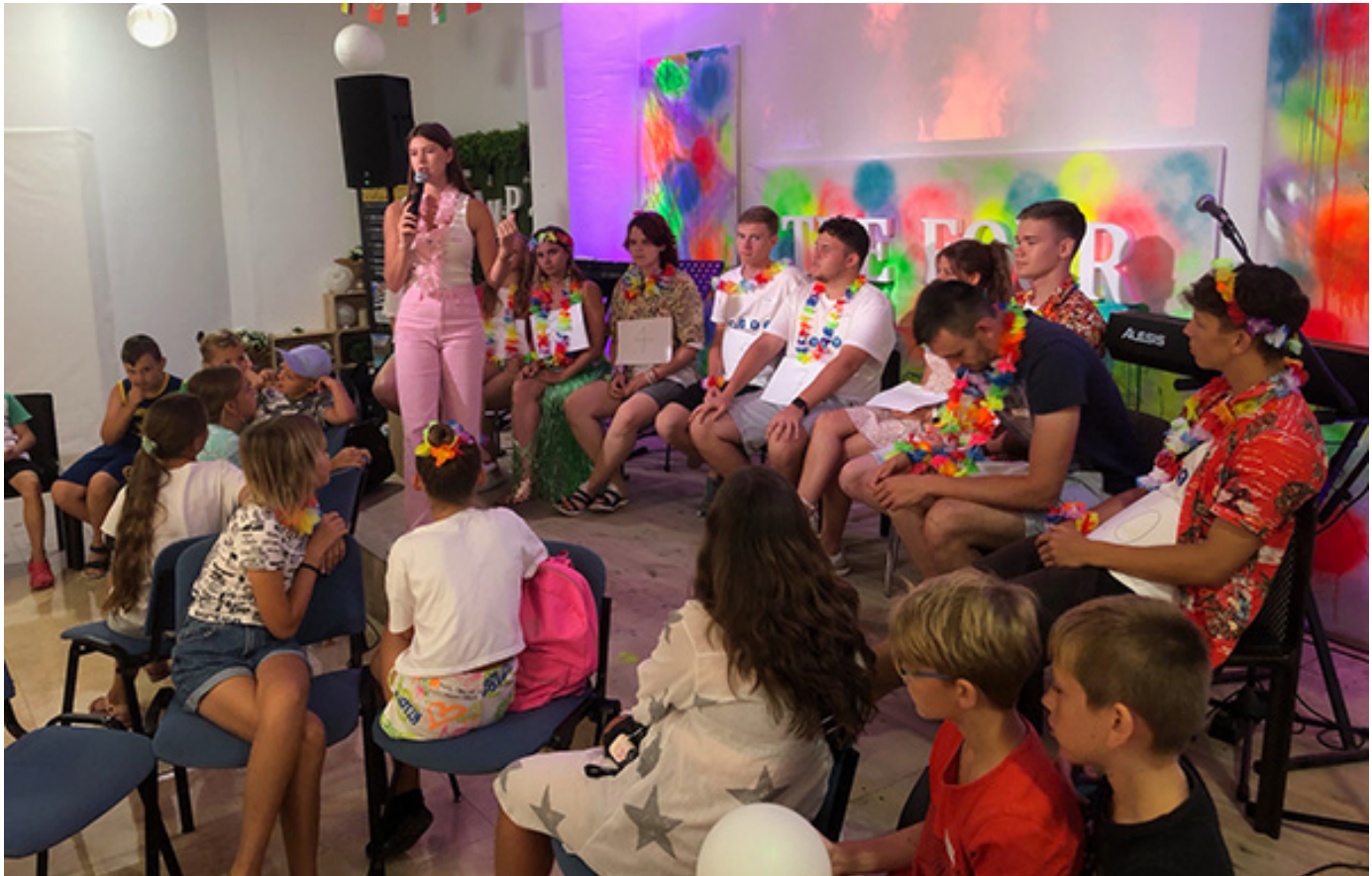
Библейские занятия во время лагеря