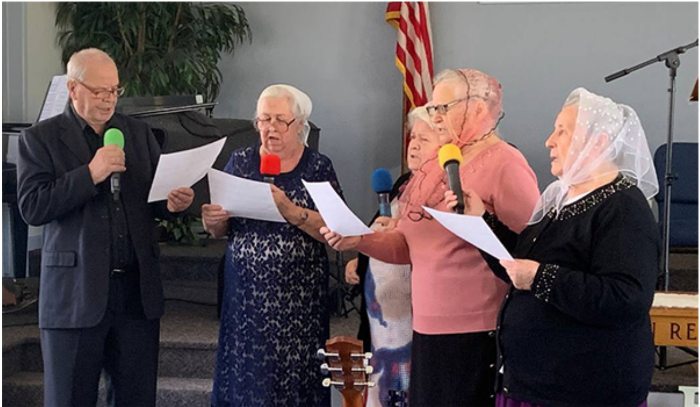
Поют гости из «Альтамедикс»