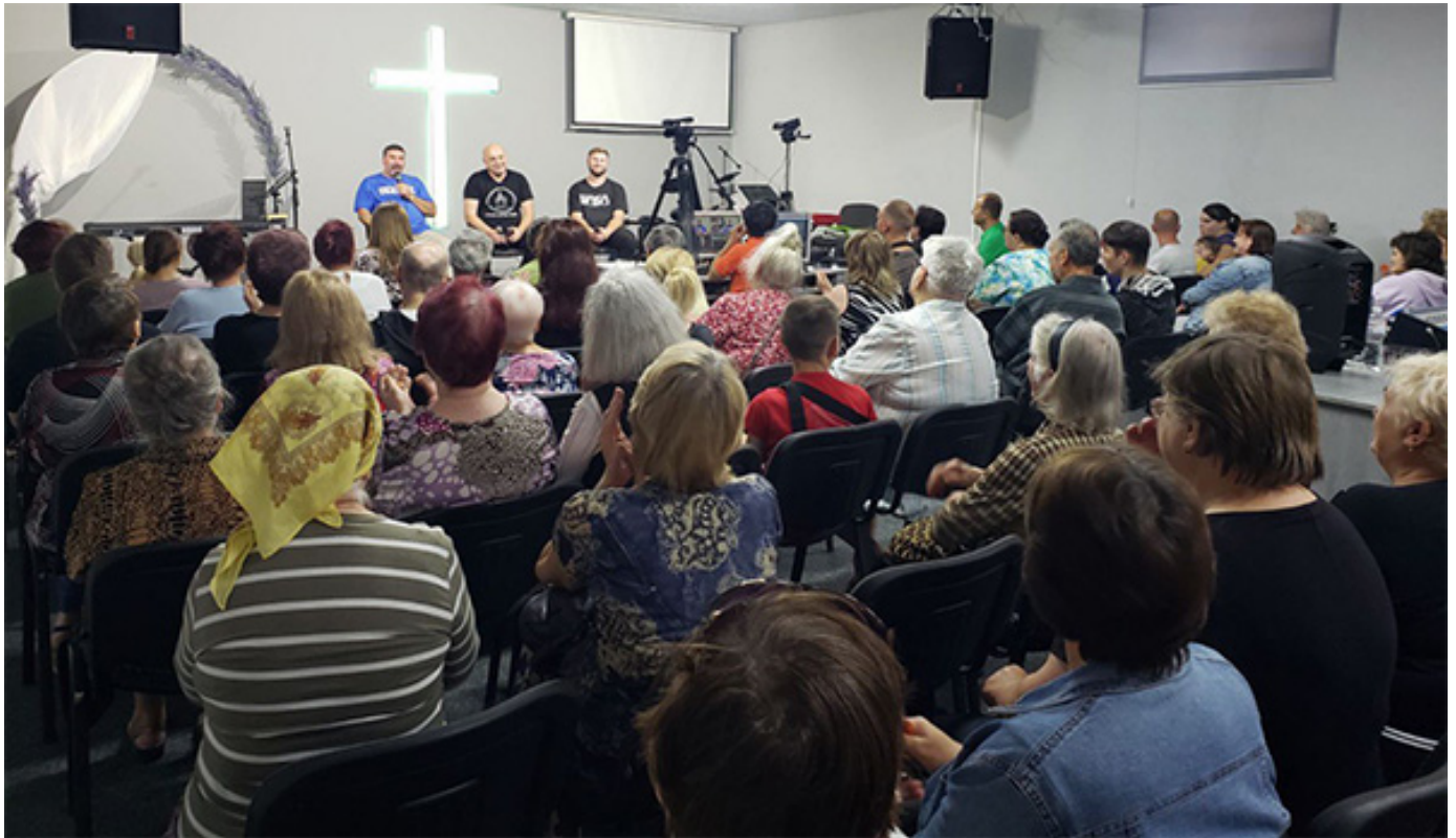
Одна из встреч в Украине