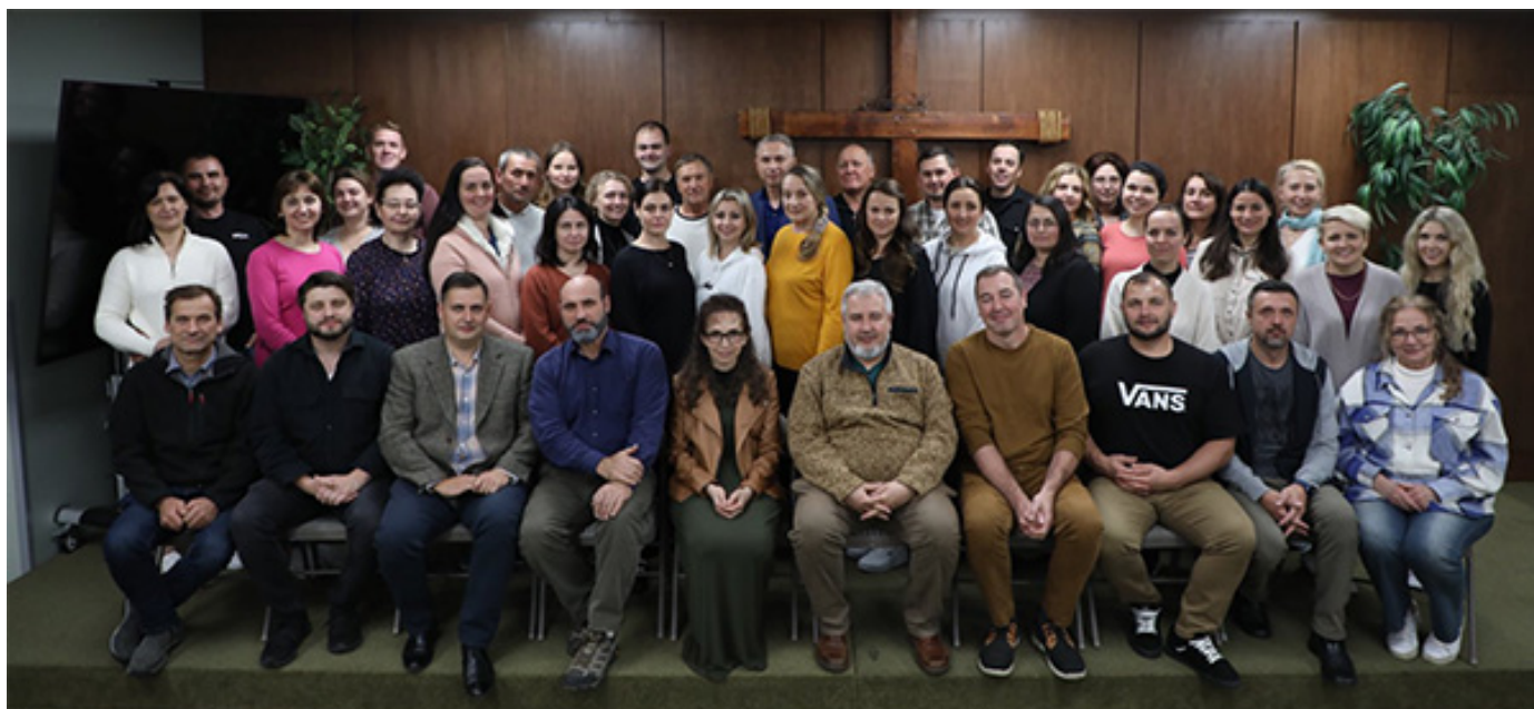
Группа студентов и преподавателей второго набора