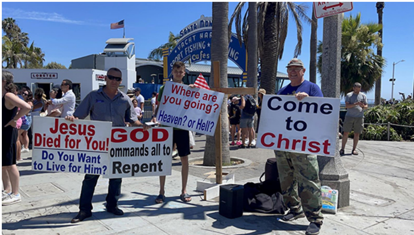
На пляже в Санта Монике