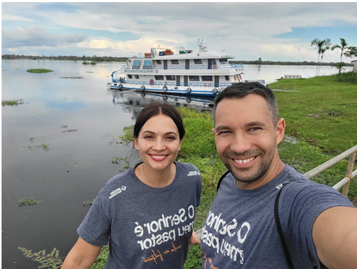
На реке Амазонка