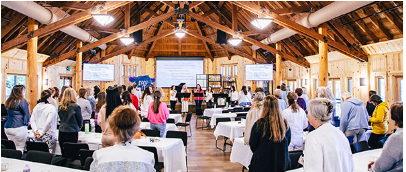
Служение во время ретрита