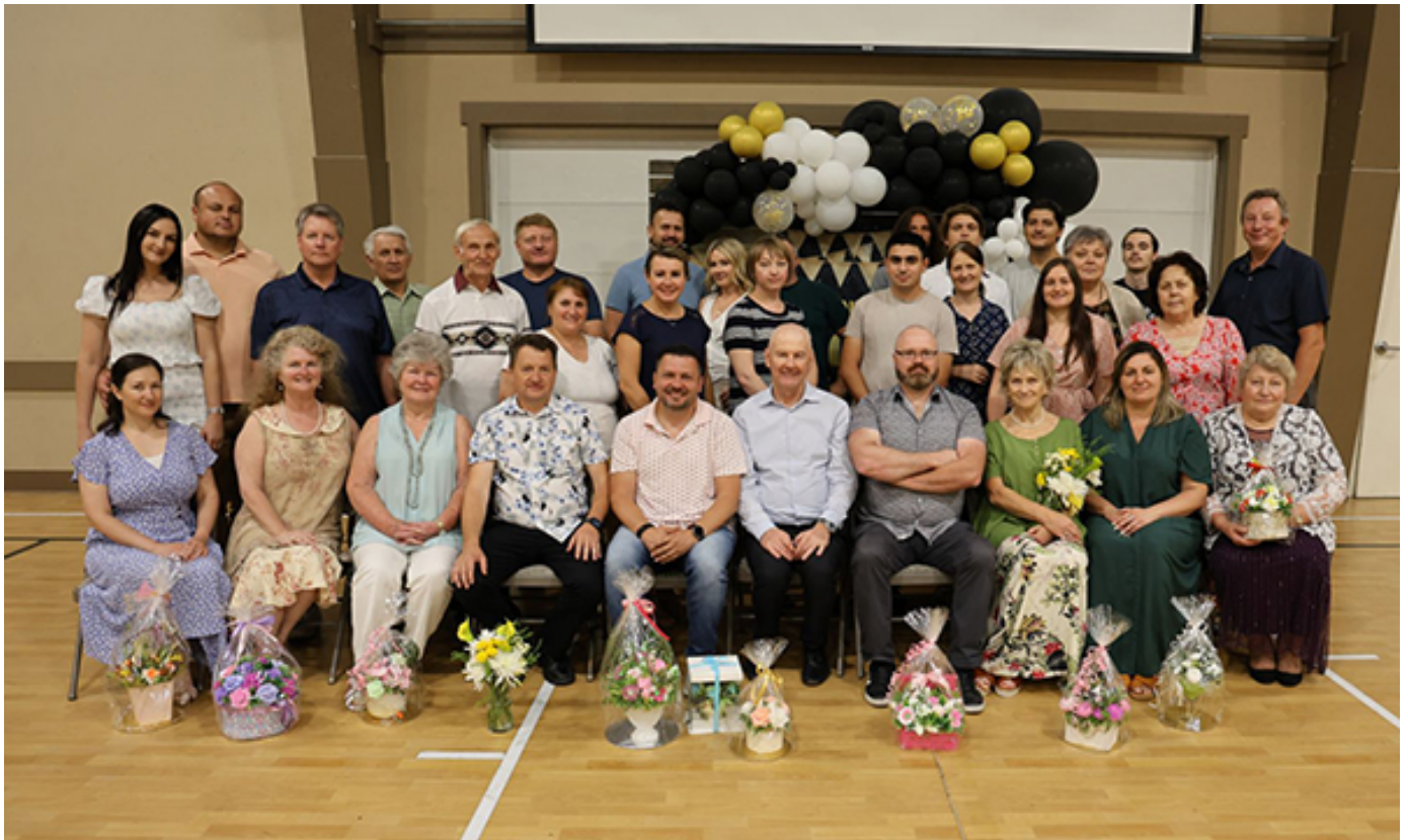
Сотрудники и волонтеры магазина