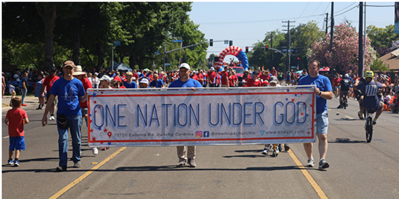
Участие церкви в параде