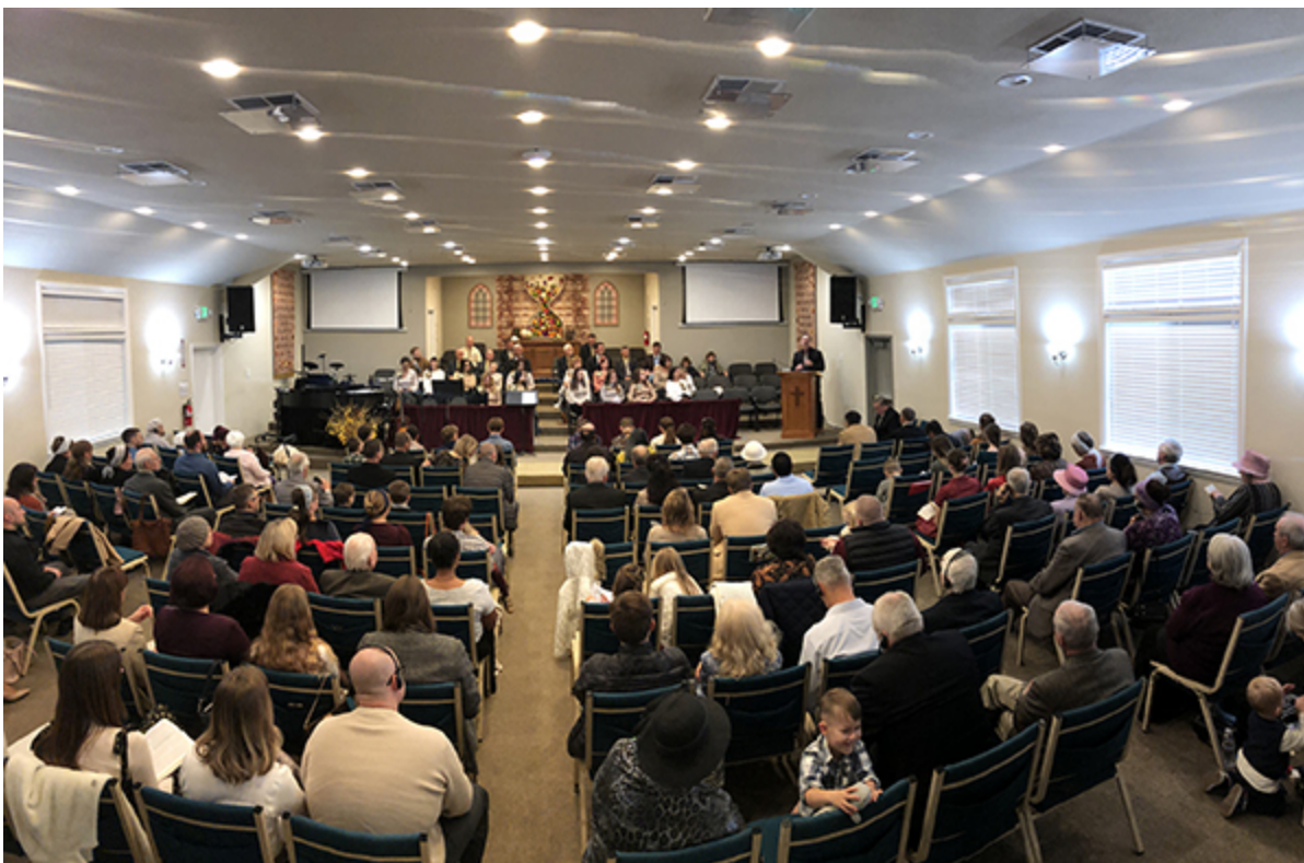
Во время праздничного служения

Двадцатого ноября прошёл праздник Жатвы в Mission Boulevard Baptist Church, Nauward. Несмотря на то, что английский и русский потоки обычно собираются в разное время, в этот день они совместно славили Господа. Праздник посетило более ста человек. Больше подробностей о празднике читайте в заметке Н. Юрковой.