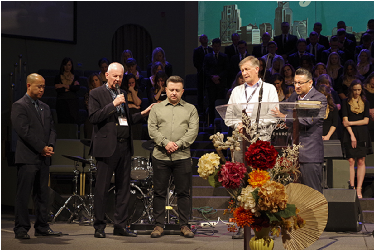
Молитва за мир в Украине

С 25 по 26 октября в помещении церкви Брайта состоялся ежегодный съезд Калифорнийского отделения Южной Баптистской Конвенции (ЮБК), на который съехались пасторы церквей, расположенных в различных уголках штата. Съезд был озаглавлен: «Лучше вместе». По традиции, съезду предшествовала пасторская конференция, которая началась на один день раньше. Подробнее о съезде – кликните эту ссылку.