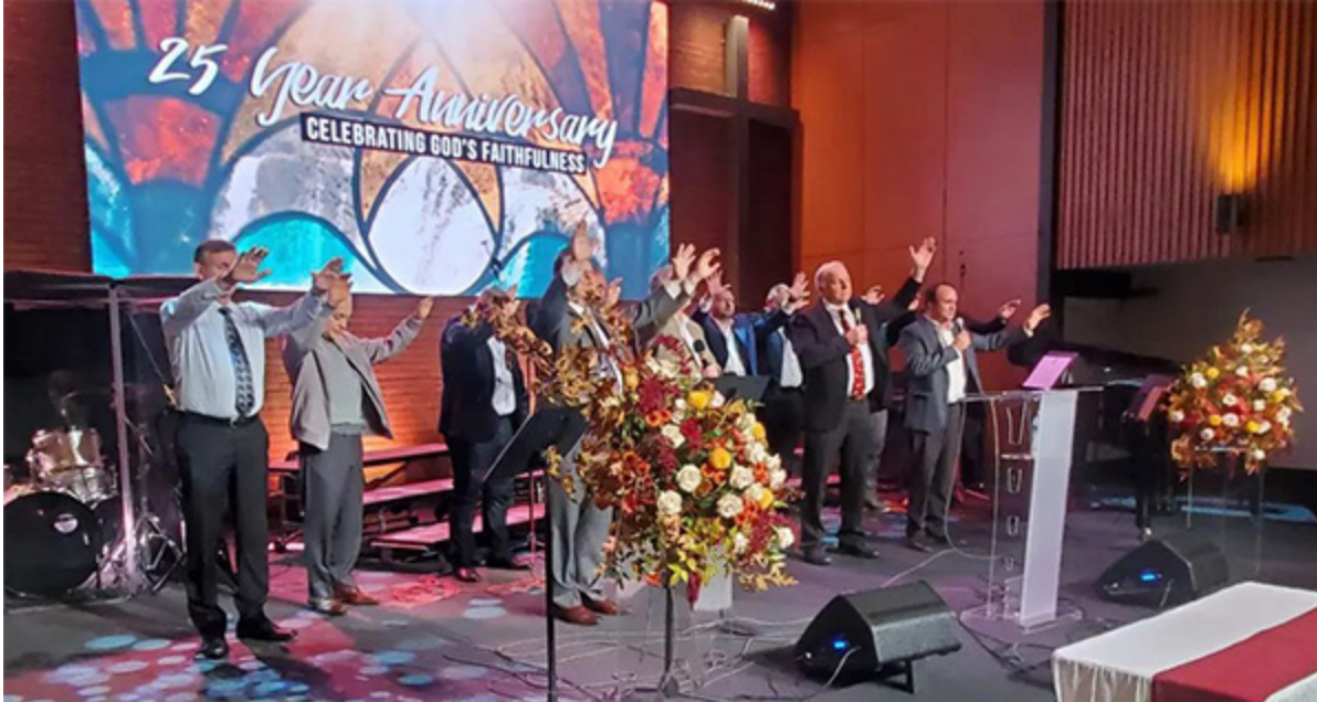
Пасторская молитва о церкви