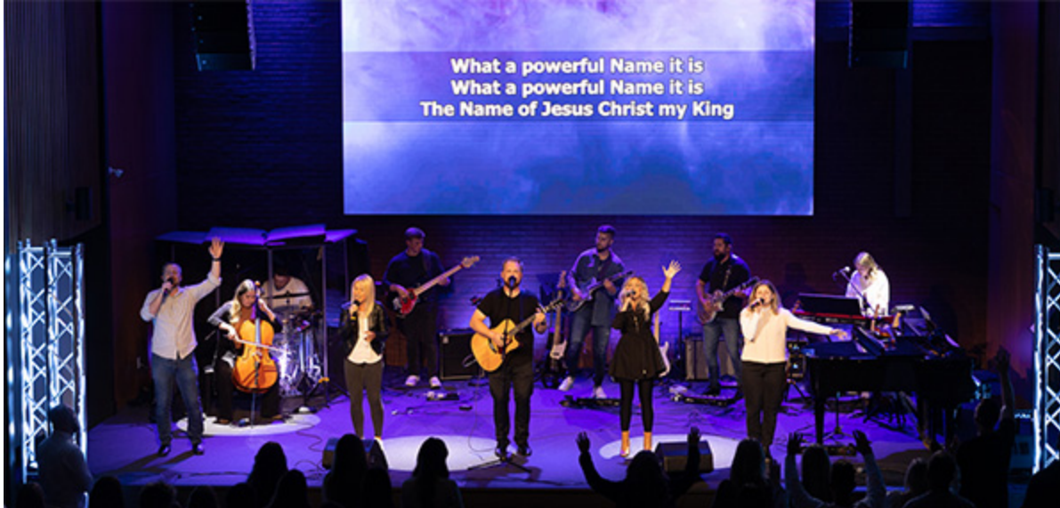
Молодежь в поклонении