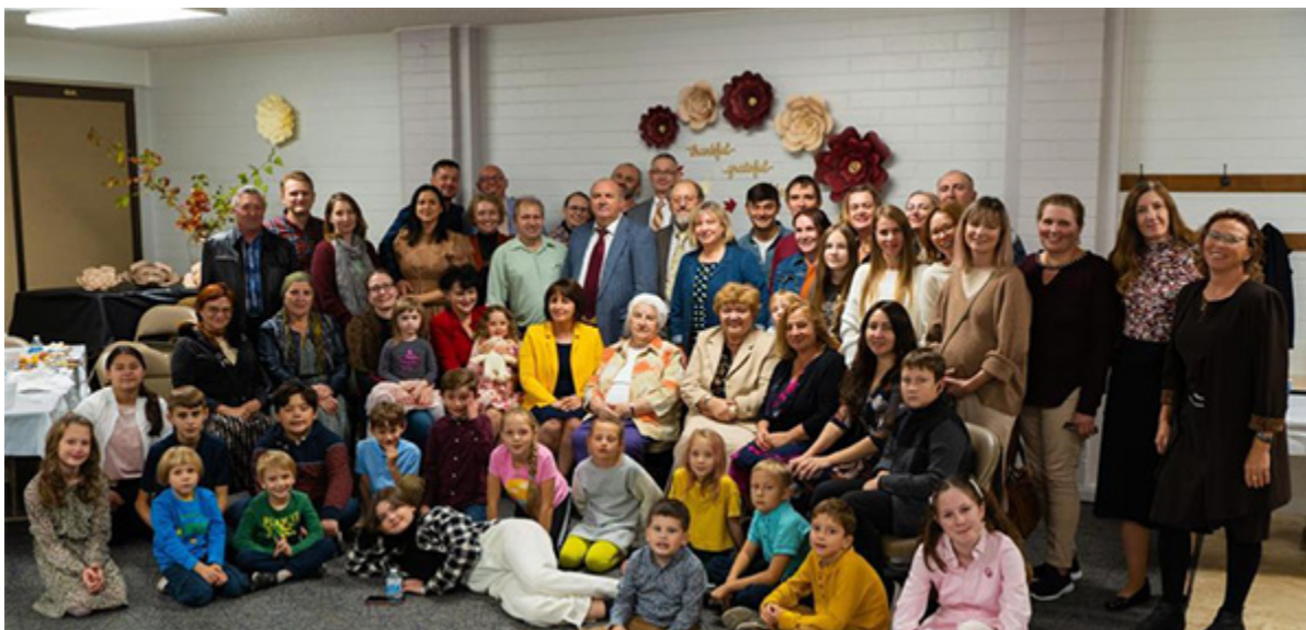
Общий снимок церкви после праздника Жатвы