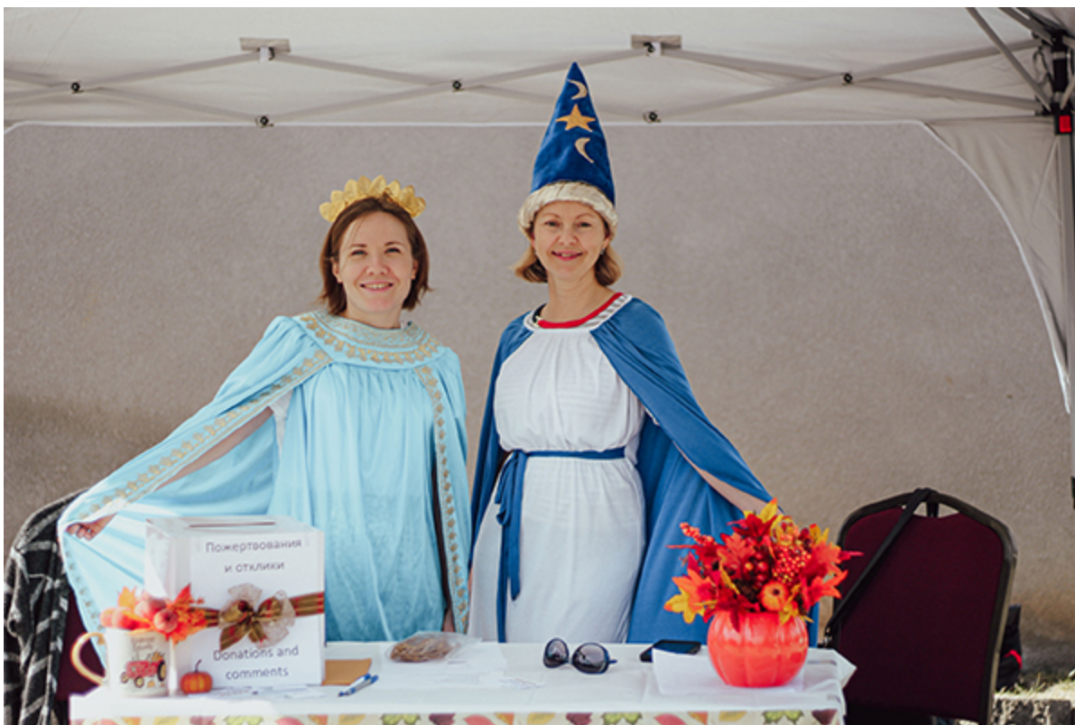
Одна из станций фестиваля

Более двухсот человек посетили осенний фестиваль церкви «Краеугольный камень», который прошел 29 октября в Сакраменто. Целью фестиваля было привлечь семьи новоприбывших иммигрантов в церковь и засвидетельствовать им о чуде Божьего творения в противовес тому обману, которым до сих пор питают детей и взрослых в современном обществе. Главным событием фестиваля стал квест “Trick or Truth” (Обман или Истина), во время которого дети вместе с родителями выполняли сложные задания и решали непростые исторические и математические задачи, чтобы прийти к конечной библейской станции и получить ответ на вопрос: «Откуда я произошёл?» К. Костюк рассказывает об этом подробнее в своей статье, размещенной на вебсайте Объединения.