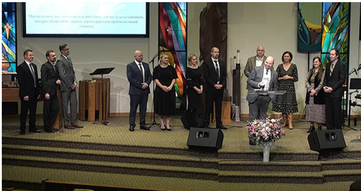
Новые диаконы церкви с женами