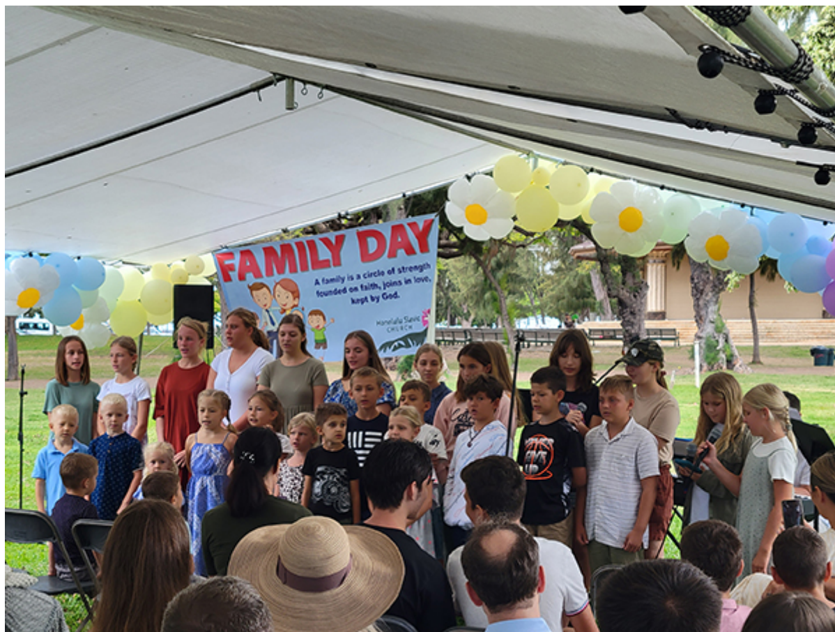
Дети тоже участвовали в служении

Капиолани. Впервые с начала пандемии 2020 года церковь собралась на такое массовое мероприятие, которое подчёркивало важность семьи как союза одного мужчины и одной женщины, созданного Богом, в соответствии с Его совершенным замыслом. Примерно 140 человек присоединилось к этому радостному событию, включая семьи гостей из Украины, Белоруссии и штатов Вашингтон, Калифорния и Нью Джерси. Подробнее – читайте статью на вебсайте Объединения.