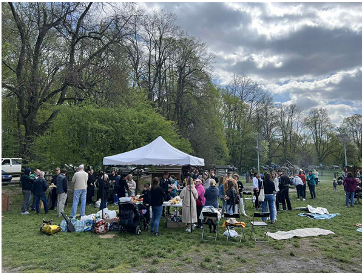
Пикник для беженцев