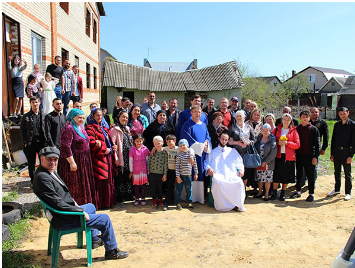
Группа верующих цыган после крещения еще одного молодого члена общества

обществе. Но Бог продолжил Свое дело. И о том, к чему это привело, читайте на вебсайте Российского союза ЕХБ – кликните эту ссылку.