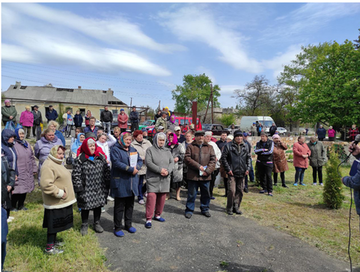
Служение в селе