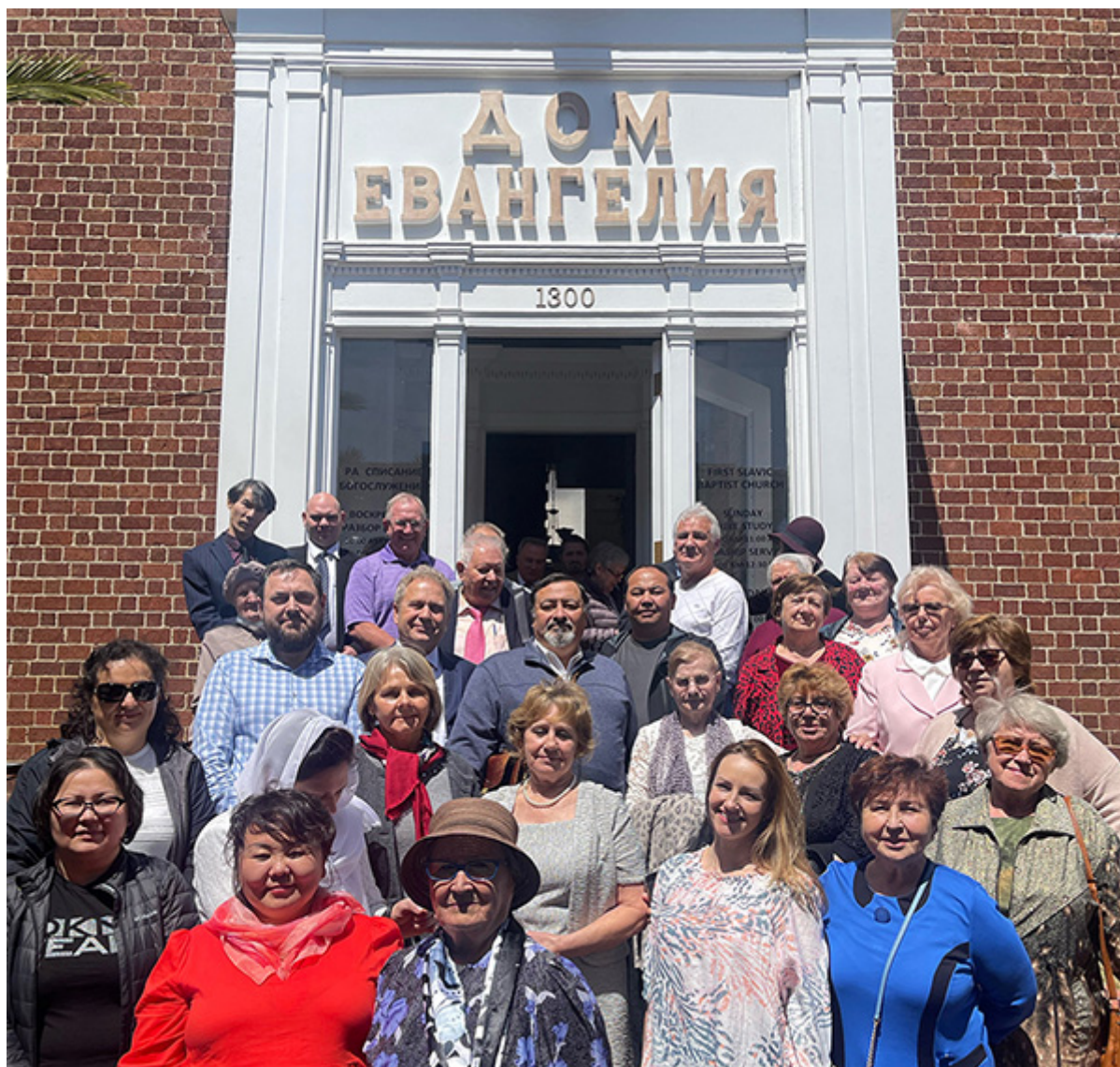
После общения в церкви «Дом Евангелия»