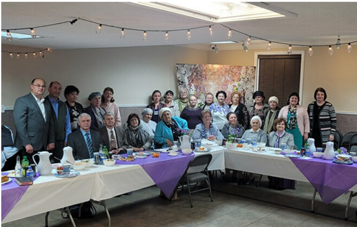
Во время одной из встреч в Славянской баптистской церкви Вест Сакраменто