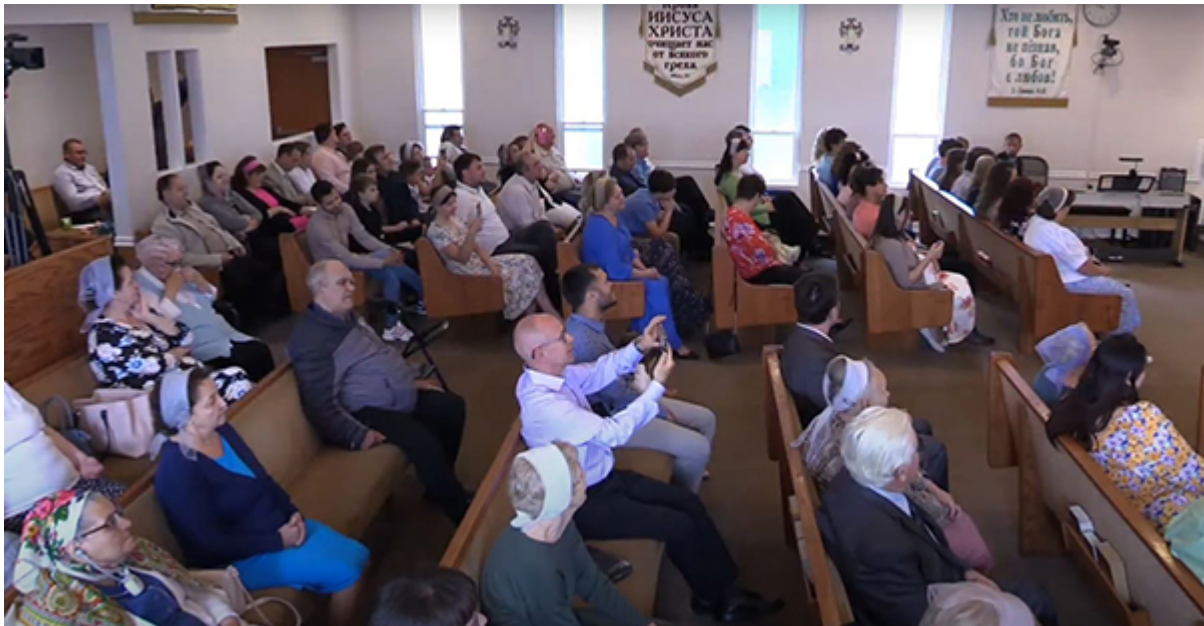
Церковь «Дом молитвы»