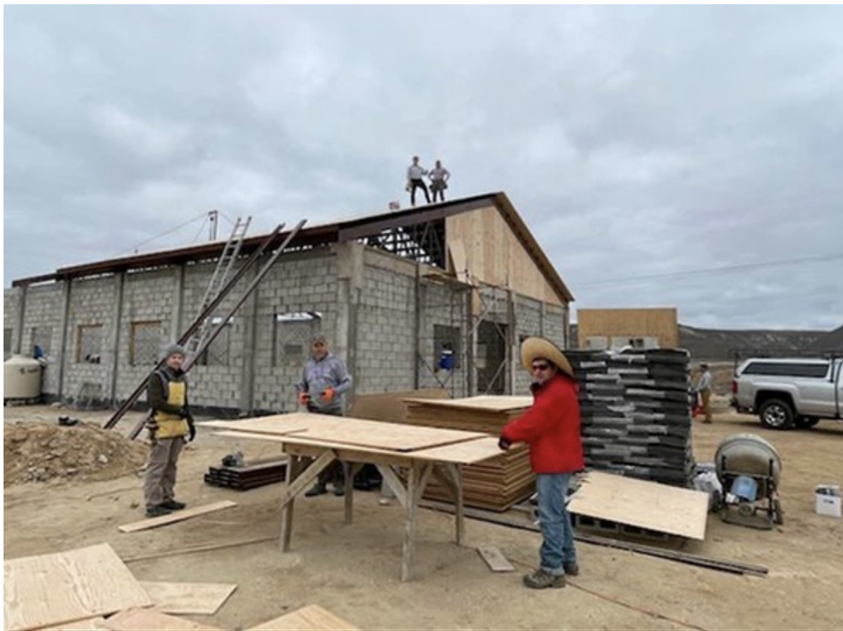
Строительство церкви в Мексике