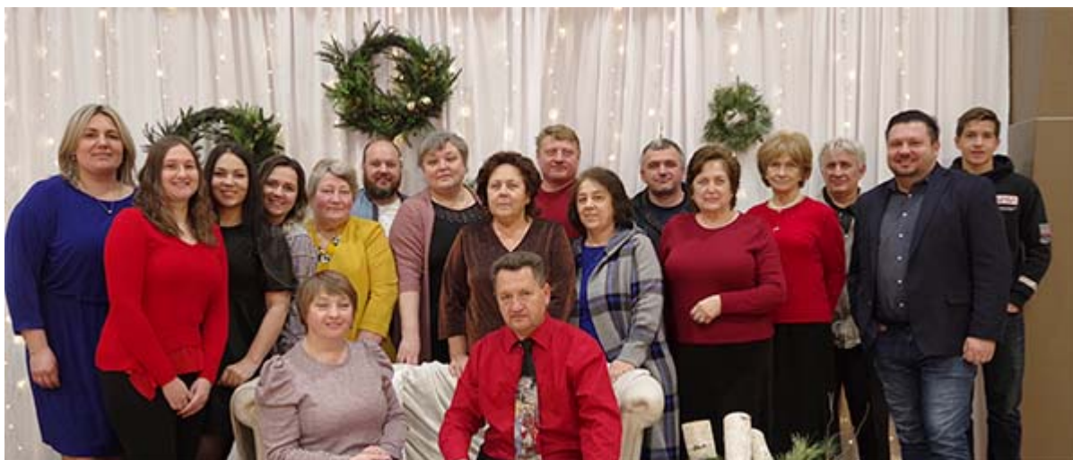
Сотрудники и волонтеры магазина

поддержку миссионеров в нескольких странах. Читайте о празднике статью на вебсайте Объединения – кликните эту ссылку.