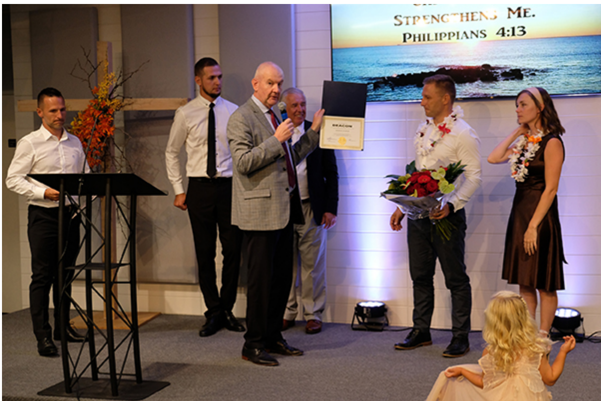
Вручение сертификата после рукоположения