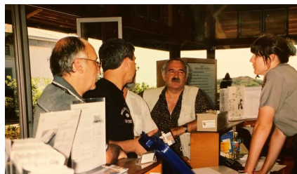
В ожидании получения разрешения на посещение заключенных.

Сегодня в тюрьмах Калифорнии находятся десятки молодых и уже не очень молодых славян, которые нарушили законы Божьи и человеческие, и теперь платят за это высокую цену – отбывают срок наказания в местах лишения свободы. Чтобы помочь им найти прощение и примирение во Христе, организовано тюремное служение. Началось оно с небольшой группы членов Брайтской церкви десять лет назад. В настоящее время в нем участвуют более ста человек из различных церквей Тихоокеанского Объединения, и трудятся они в десятках тюрем, разбросанных по всей Калифорнии.