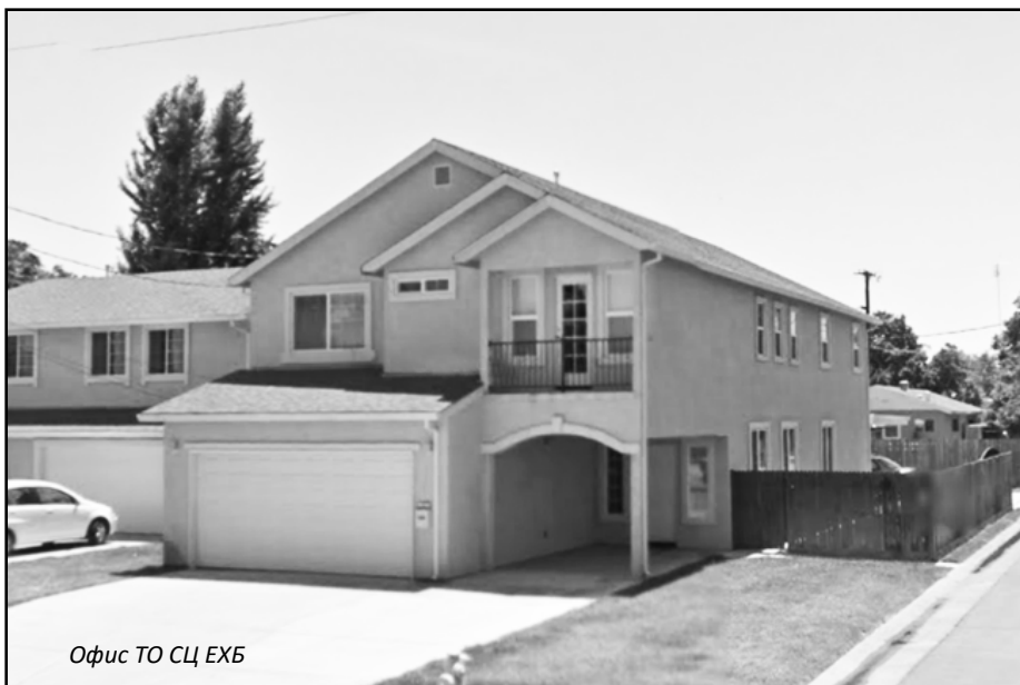
Офис ТО СЦ ЕХБ