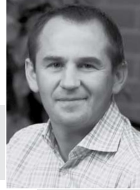
Руководитель детского клуба «АВАНА»