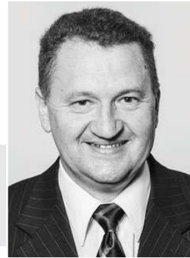
Директор Pacific Trift Store