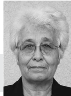
Руководитель отдела интернет служения

«И все, что вы делаете, словом или делом, все [делайте] во имя Господа Иисуса Христа, благодаря через Него Бога и Отца... И все, что делаете, делайте от души, как для Господа, а не для человека.» Кол. 3:17-23