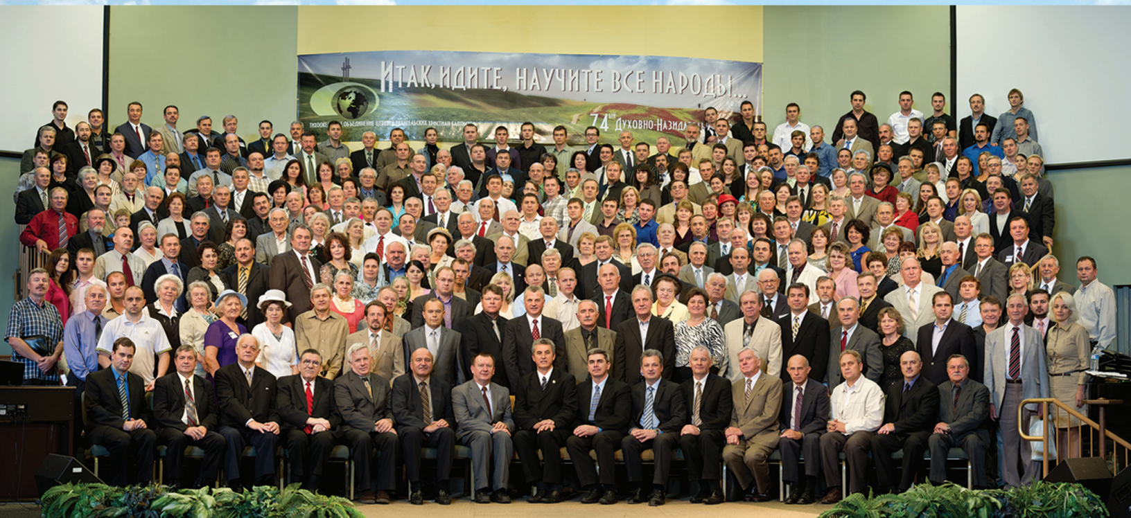
74 Съезд ТОСЕХБ. 20-23 октября 2011г. Сакраменто