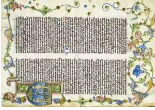
Страница из книги «Иудейские древности»