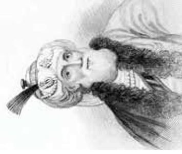
Ильям Уистон. Воспроизводимый портрет Иосифа Флавия. 1737

(из книги «История раннего христианства». А. Ковальницкий).